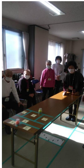
卓上カーリング 力加減が難しい