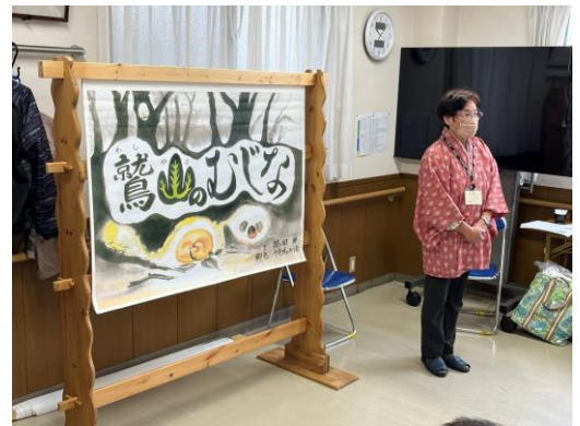
増尾の昔話の「鷲山のむじな」 このお話の看板が鷲の山公園にあります