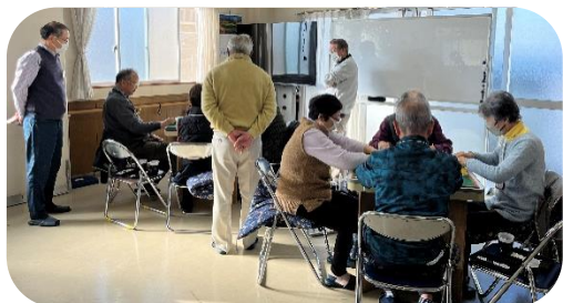
スタッフも真剣に見学