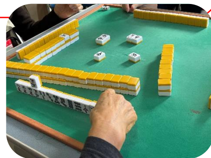
良い手の時に写真を撮ってと注文が