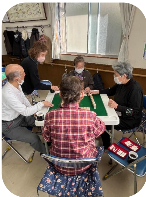
初心者グループにアドバイスする スタッフ