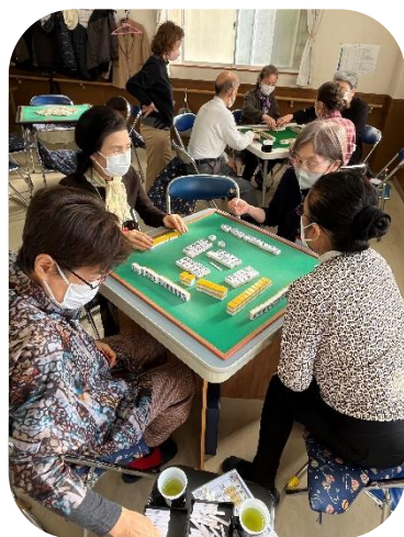
会話がはずみます