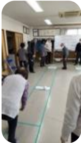
ペットボトルボーリング