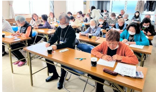
みんな一緒にやるから楽しい脳トレ！