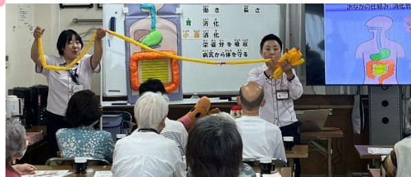
小腸は伸ばすとなんと6メートルの長さに