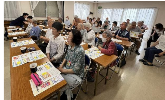
勉強熱心な皆さん