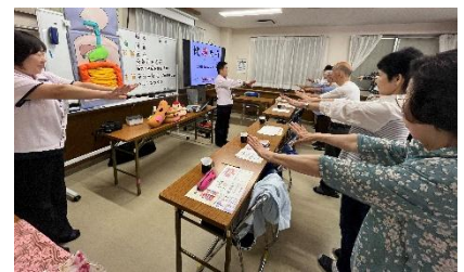
東京音頭を歌いながらからだを動かします