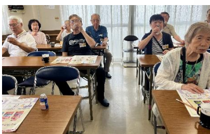
ヤクルトの試飲も