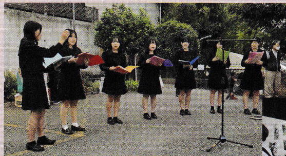
柏南高校合唱部のアカペラ。歌うことの楽しさが笑顔になります（文化祭）