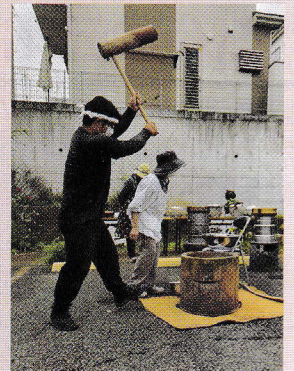
つきたてのお餅は、毎年大人気（地域ふれあいのつどい）