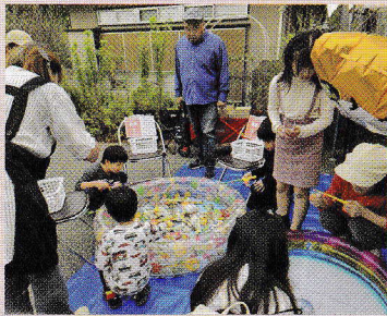
ゲームコーナーに夢中。釣れたかな（地域ふれあいのつどい）

2024年10月26日（土）に「地域ふれあいのつどい」、10月26日（土）・27日（日）に「第42回文化祭」を開催しました。10月27日に総選挙の投票会場として体育室が使用されたため、「防災パネル展」は中止、「文化祭」は増尾近隣センター本館のみでの開催となりました。会場は縮小されましたが、力作揃いの作品が所狭しと展示され、鑑賞する人でにぎわいました。「地域ふれあいのつどい」は例年通り開催され、模擬店には行列ができました。