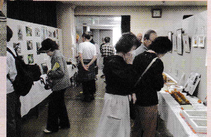
2階展示会場はたくさんの作品が並びました（文化祭）