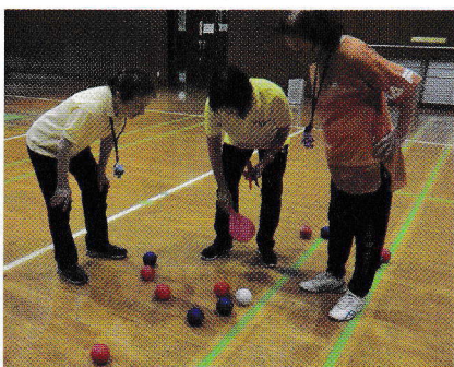
白い的玉に近いのはどっち (ボッチャ)

まずひとつ目は「ボッチャ」です。パラリンピックの正式種目でもあり、障がいの有無にかかわらず、全ての人が参加しやすいスポーツです。ルールがシンプルのため、子どもから高齢者まで楽しめます。ふたつ目の「モルック」は、フィンランドの伝統的なゲームを基に開発されたスポーツです。22.5cmの木の棒を投げて、12本の木のピンを倒して採点し、先に50点ピッタリになったチームが勝ち。もし50点を超えると減点されて25点になってしまう、少し頭脳戦の要素もあるゲームです。「ボッチャ」と「モルック」どちらもチーム戦で、失敗してもうまくいっても笑いが絶えません。