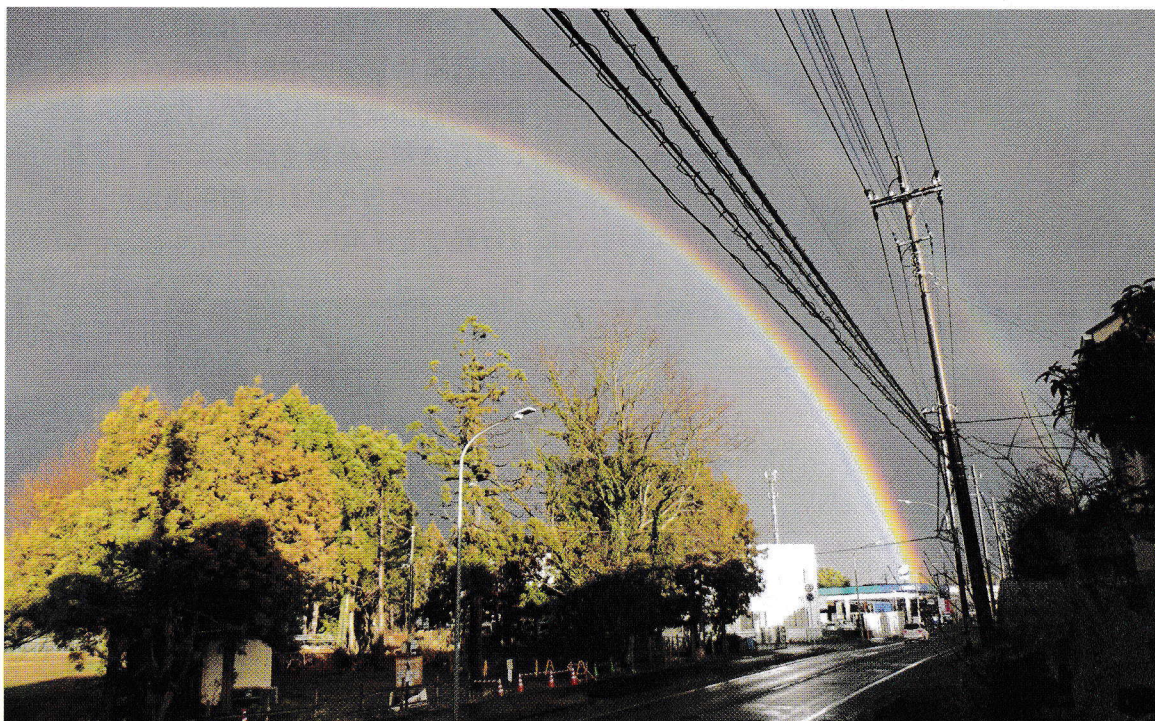
ダブルレインボー