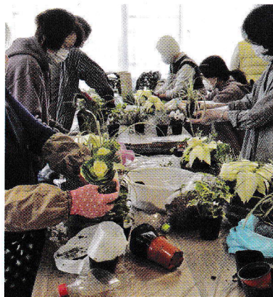
鉢の中の花のレイアウトは?

今回のコンセプトは「大人可愛いシックなクリスマスを演出」。主役の植物はシックな白のポインセチア、脇役の植物も主役の色味をサポートする白いガーデンシクラメンにし、器もアンティークな雰囲気のものを使用しました。寄せ植えした植物は、①ポインセチア ②ガーデンシクラメン ③クッションブッシュ (プラティナ) ④斑入りノシラン (ミスキャンタス) ⑤ハボタン