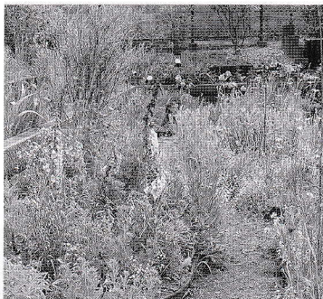
ガーデン一面に咲き誇る花々

増尾近隣センター駐車場にあるペレニアル花倶楽部ガーデンでも、コーンフラワー、ジキタリス、グラスペディアグロボーサなどが咲き誇り、来場者を迎えました。