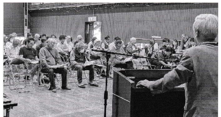
会計報告に耳を傾ける総会会場の参加者

私は常々申し上げていますが、ボランティア活動に携わることは、まずは自分が楽しむことだと思っています。共に活動をしている方や事業に参加して下さる方にも、楽しんでいただけるような活動を実施するためには何ができるか話し合いを重ねていきます。