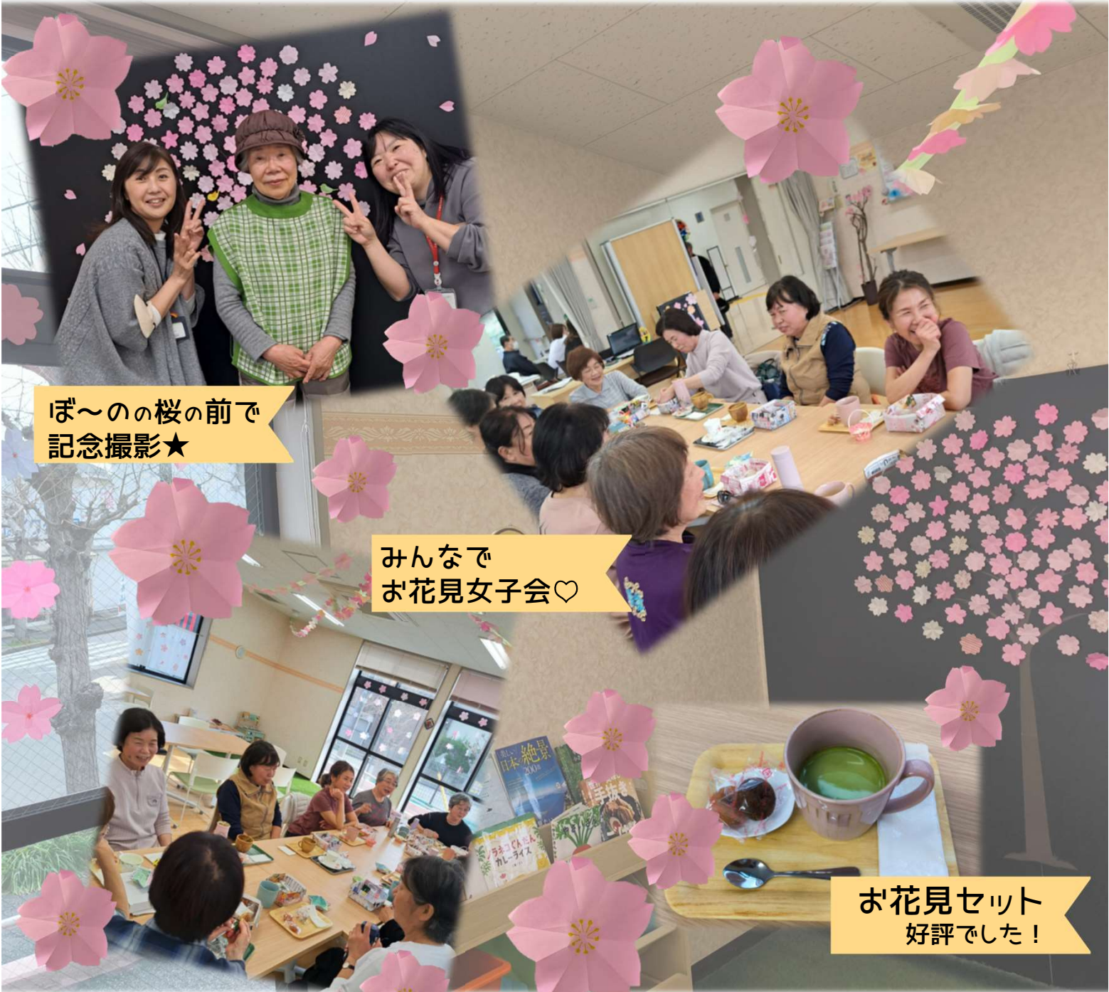
ぼ~のの桜の前で 記念撮影★