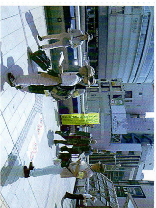
▲駅前啓発活動の様子