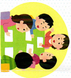
▶研修会受講の様子