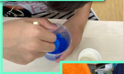
魔法の水を 入れて かき回すと