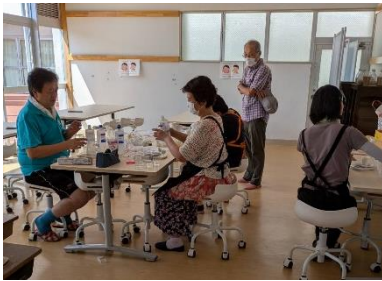
沢山の子供達に来てくれるかな(?)