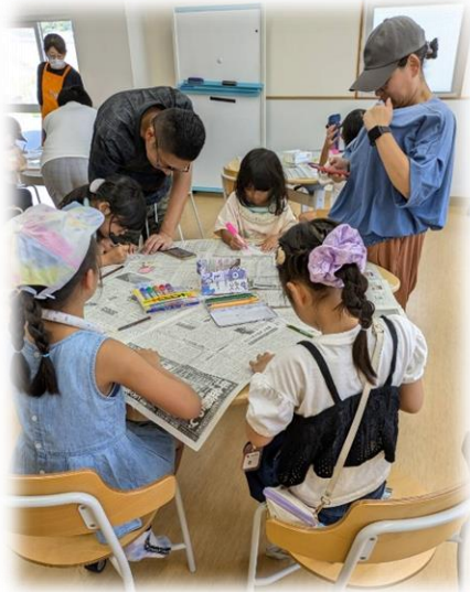
相談しながら書きました